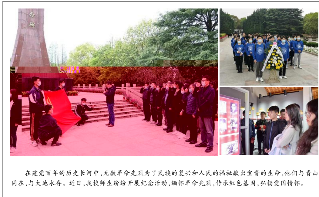
在建党百年的历史长河中,无数革命先烈为了民族的复兴和人民的福祉献出宝贵的生命,他们与青山同在,与大地永存。近日,我校师生纷纷开展纪念活动,缅怀革命先烈,传承红色基因,弘扬爱国情怀。

享R 6观点|顾w资 \秦清T 丞投资 \孙文 - . I 9" R 何投资$ 验室34|临沂r 3}蔡 u - . $ 介绍R 何;准描" 3 4需 T34供需 3巧| 2 翔资 营公司( 肖立K 9 " R当P. [ 34 移存+6问 $T : 问$6办法| 其 , 4 \2也纷纷交流R34 移O{ 6 J| 坛 进QR. {伙 签约 T34 移 问聘@hi| (校技术转移中心供稿)